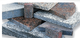
Granit und Naturstein